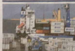
Hagnaður Eimskipa jókst um 37,1 prósent milli ára.

lena samninginn. Nú hafa öll þrjú félögin, SFR, SFLÍ og LL samþykkt samninga. – sg