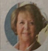
Vigdís Finnbogadóttir er fyrsta konan í heimi sem er lýðræðislega kjörin þjóðhöfðingi.