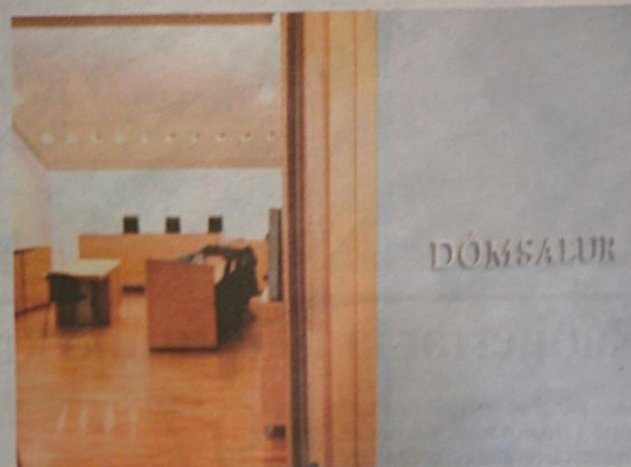
Karimaður var sýknaður í Héraðsdómi Suðurlands af nauðgun því ekki tókst að sanna að hann hefði ætlað sér að nauðga sautján ára samstarfskonu sinni.

„Það má ekki gleymast að í refsirétti verður maður eingöngu sakfelldur ef hann hefur haft ásetning til að fremja brot, nema heimilt sé að refsfa fyrir gáleysisverknað. Ásetningur er fortaklaust skilyrði refsíabyrgðar fyrir nauðgun,“ segir Svala Ísfeld Ólafsdóttir. svaer@frettbladid.is